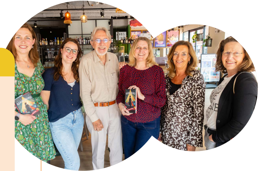
Dit jaar was o.a. auteur Jacques Vriens te gast bij de leesclub Jeugdliteratuur. Deze leesclub komt vier keer per jaar samen en is speciaal voor leerkrachten.